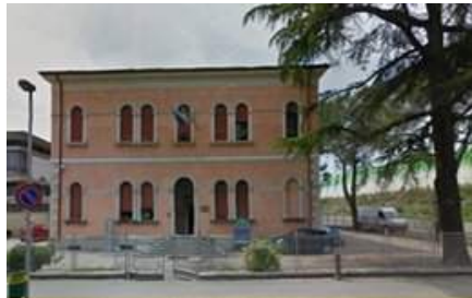
Sede del Professionale Via Pittoni, 16