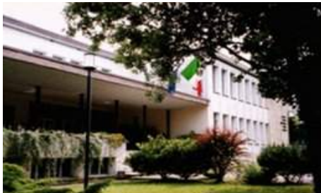
Sede del Tecnico Via Galilei, 16